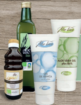
Gelenk Aktiv Set 1 x Bio Aloe Vera Saft 1 x Bio Leinöl 1 x Gel Arnica 83 % 1 x Gel 86 %