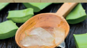
Aloe Vera Gel aus Blattinneren