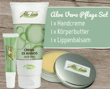
Aloe Vera Pflege Set 1 x Handcreme 1 x Körperbutter 1 x Lippenbalsam