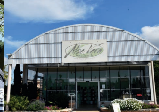
Verkauf und Produktion auf der Farm