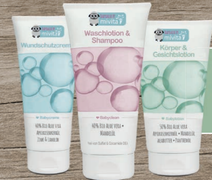
Aloe Vera Baby Set 1 x Wundschutzcreme 1 x Waschlotion & Shampoo 1 x Körper & Gesichtslotion