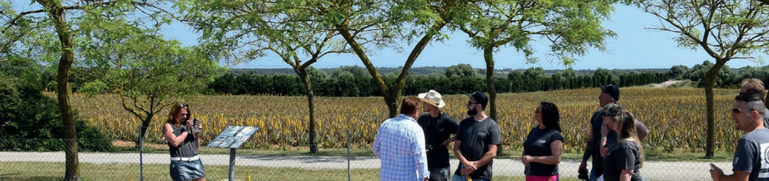
Regelmäßige Besichtigung und Schulung: MIVITA Berater auf der Bio Aloe Vera Farm auf Mallorca