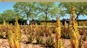
Aloe Vera zur Blütezeit