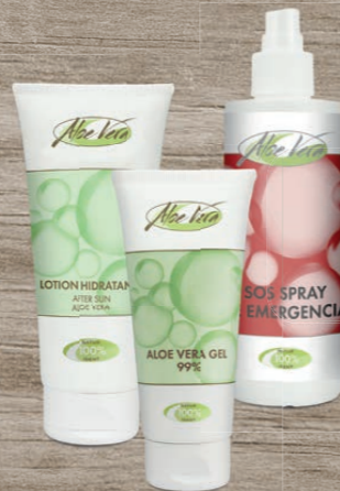
Aloe Vera Holiday Set 1 x After Sun Lotion 1 x Gel 99 % 1 x SOS Spray