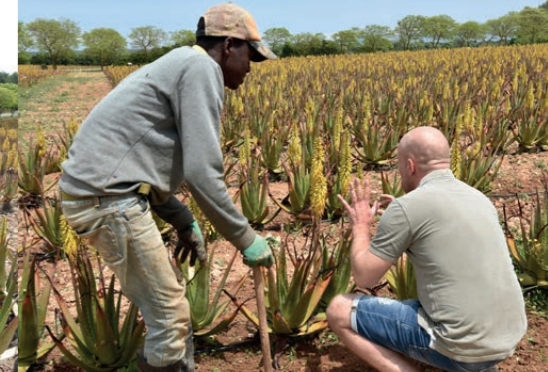
BIO Aloe Vera: Unkrautjäten von Hand