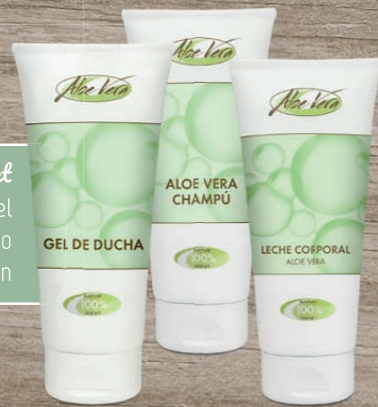
Aloe Vera Körper Set 1 x Duschgel 1 x Shampoo 1 x Bodylotion