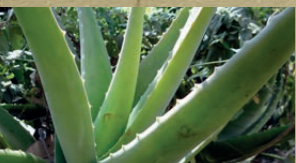
Auch „Wüstenlilie“ genannt