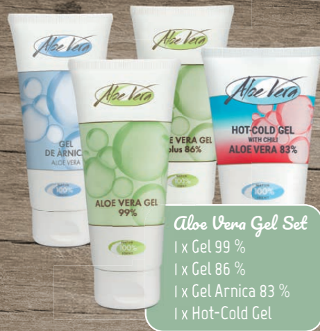
Aloe Vera Gel Set 1 x Gel 99 % 1 x Gel 86 % 1 x Gel Arnica 83 % 1 x Hot-Cold Gel

Wir bieten unseren Kunden in regelmäßigen Abständen Aktions-Sets an, die Du dann im Aktionszeitraum vergünstigt einkaufen kannst. Schau online nach oder frage Deinen Berater.